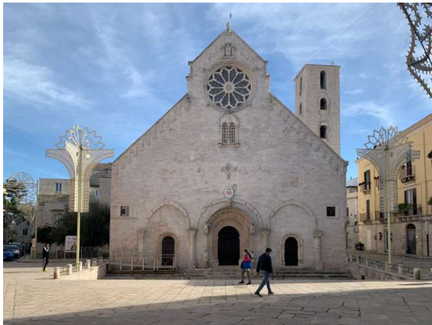
CATTEDRALE DI SANTA MARIA ASSUNTA

Il Museo ha sede presso il Convento dei Domenicani, eretto intorno al 1560. L'edificio sorge fuori dalle antiche mura della città, in corrispondenza della Porta Noè. Attorno al suggestivo chiostro interno si snodano i percorsi artistici tra le opere di Domenico Cantatore, pittore ruvese, e Michele Chieco.