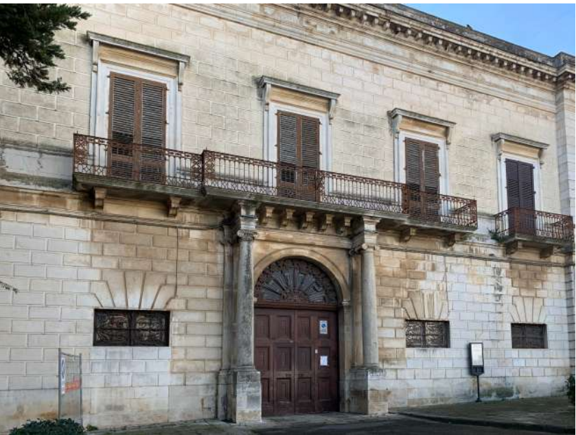
MUSEO ARCHEOLOGICO NAZIONALE JATTA

Il Museo Nazionale Jatta custodisce una parte dei reperti archeologici ritrovati a Ruvo di Puglia e custoditi dalla famiglia ruvese Jatta. L'edificio costituisce uno dei rarissimi esempi di collezione privata ottocentesca rimasta inalterata nella sua concezione museografica originaria. Al suo interno, oltre a poter ammirare vasi in terracotta dell'età peuceta, vasi a figure rosse su sfondo nero di produzione greca e locale e busti marmorei, è possibile ripercorrere le forme architettoniche, l'arredo e le idee che hanno presieduto la sua realizzazione nel corso del XIX Secolo.