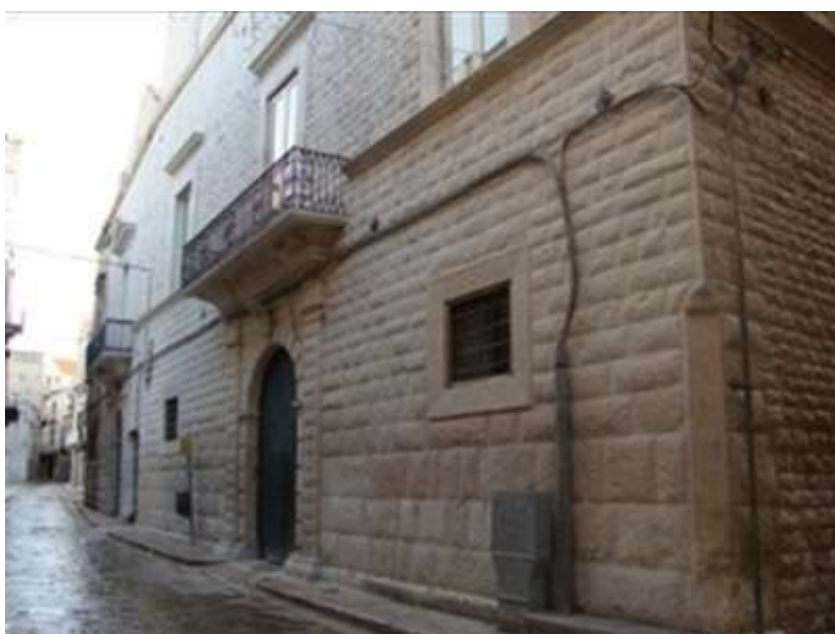
MUSEO DEL LIBRO PALAZZO CAPUTI

Il Museo Nazionale Jatta custodisce una parte dei reperti archeologici ritrovati a Ruvo di Puglia e custoditi dalla famiglia ruvese Jatta. L'edificio costituisce uno dei rarissimi esempi di collezione privata ottocentesca rimasta inalterata nella sua concezione museografica originaria. Al suo interno, oltre a poter ammirare vasi in terracotta dell'età peuceta, vasi a figure rosse su sfondo nero di produzione greca e locale e busti marmorei, è possibile ripercorrere le forme architettoniche, l'arredo e le idee che hanno presieduto la sua realizzazione nel corso del XIX Secolo.