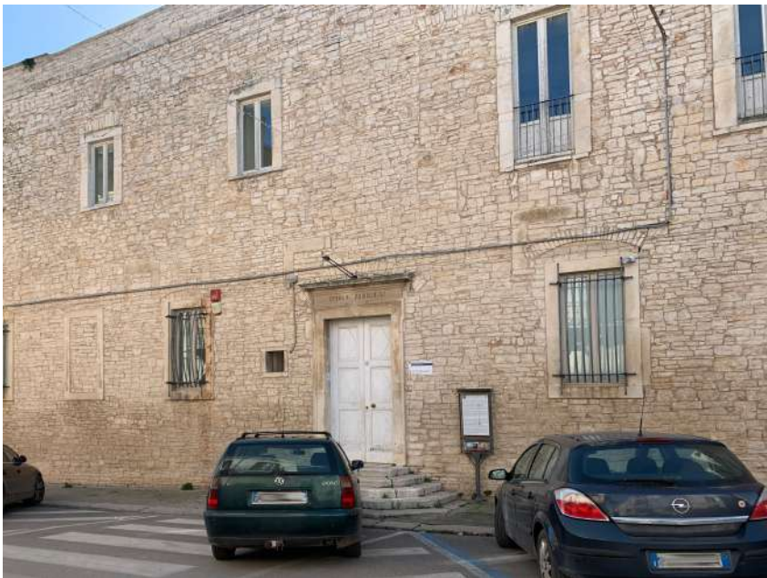
PINACOTECA D'ARTE CONTEMPORANEA DOMENICO CANTATORE

Il Museo del Libro - Casa della Cultura di Ruvo di Puglia è un museo civico che ospita le raccolte librerie della Biblioteca Comunale. Ha sede presso l'antico Palazzo Caputi, edificio nobiliare nel nucleo antico della città. Il Museo è dotato di una sala conferenze e ambienti dedicati alle attività didattiche e laboratoriali, una sala lettura, una sala studio e sale per esposizioni permanenti e temporanee.